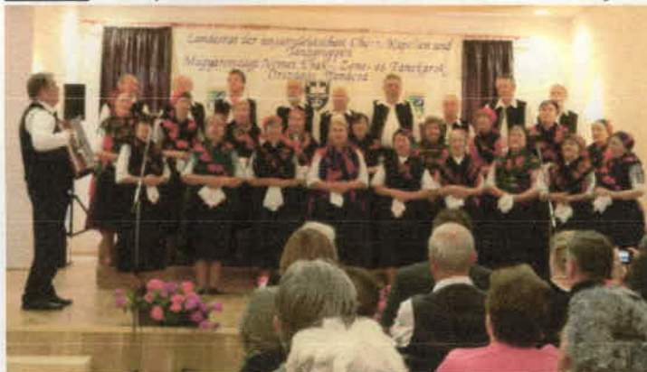
Német Nemzetiségi Kórusok Minősítője (Landesrat), Mözs (6.)

Június hónapban minősítőn vettünk részt, ahol arany fokozatot értünk el.