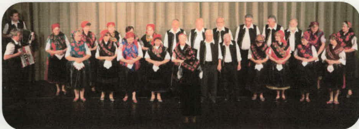
Babits Mihály Kulturális Központ avató-megnyitó műsora. (7.)

Augusztusra a is érkezett fellépésre való felkérés. videó