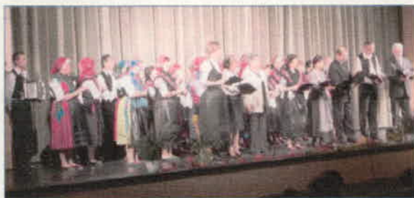
Die ehemaligen Dirigenten überraschten Chor und Publikum mit einem gemeinsam gesungenen Brahms-Lied