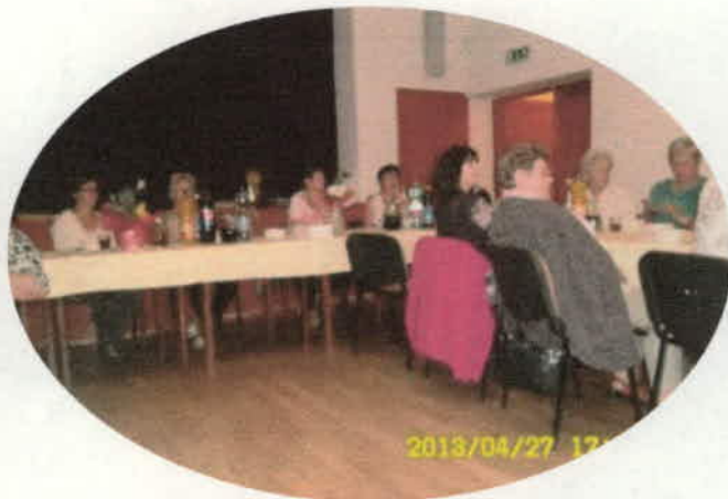
Német Nemzetiségi Kórustalálkozó Mözs (4.)

Májusban a Szekszárdi Német Nemzetiségi Klubbal közösen meghirdettünk egy találkozót azok számára, akik szerettek volna német népdalokat tanulni, német népszokásokkal ismerkedni, recepteket cserélni. Vendégeink voltak: Mözsi Német Nemzetiségi Kórus, Kakasdi Német Nemzetiségi Kórus, Óbányai Német Nemzetiségi Klub. (5.) Mindhárom kórus műsorral készült. Remek alkalom nyílt arra is, hogy az idősebbektől mi is tudjunk dalt gyűjteni.