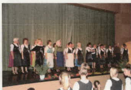
Mindenki a saját faluja viseletében.