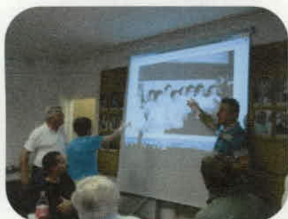
Az első szereplés 1978-ban. „Névsorolvasás”