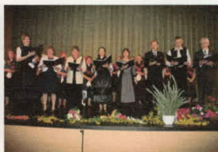
Egykori karnagyok köszöntője.