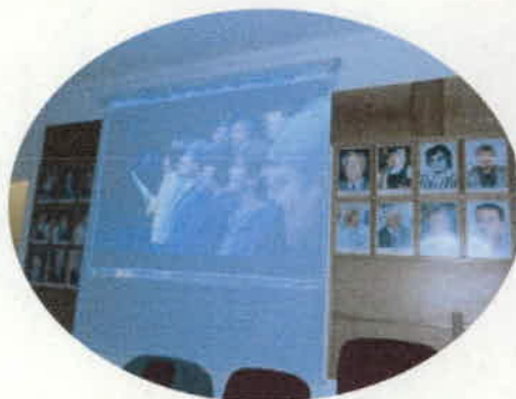
Az év eseményeiről készült képeket örömmel nézegettük.