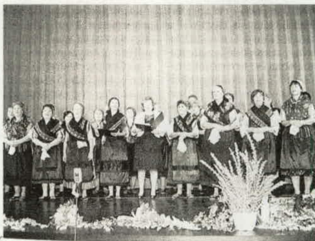
A Mondschein Kórus a jubileumi hangversenyen az Agóra Színháztermében

rendezvényein. Szoros kapcsolatot ápolnak a többi magyarországi német nemzetiségi kórusal a megyén kívül is. Számos külföldi kapcsolatuk van. Már többször elnyerték az arany fokozatot a minősítő hangversenyeken. Megkapták a Szekszárdi Németiségért dívját, a 2010-ben megrendezett minősítésen kitüntetéses arany fokozatot érték el. Nemzetközi ezüst minősítést kapott a kórus a XIII. Budapesti Nemzetközi Kórusversenyen 2011-ben. Nemrégiben tartották meg nagy sikerrel, a kassai, zombai és tolnai kórusok részvételével jubileumi hangversenyüket a Babits kulturális központ színháztermében. ■ I. I.