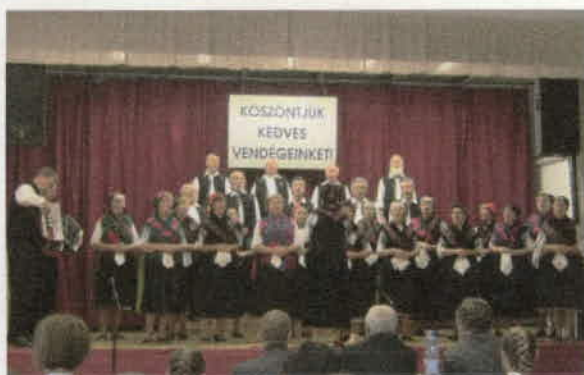
Tatabánya, népzenei minősítő