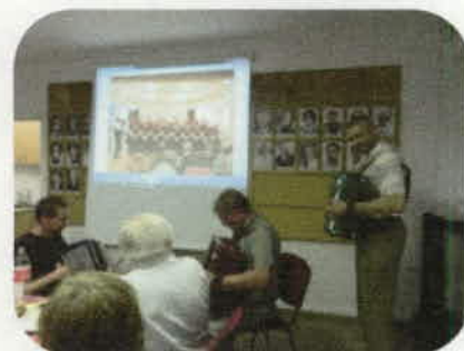
Három harmonikás adta meg a hangulatot.