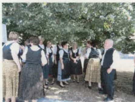
Készülődés a felvonulásra. A felvonuláson énekeltünk is. (9.)