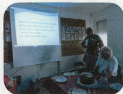
A kedvenc dal.