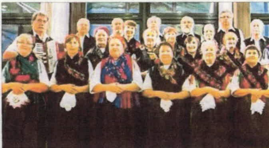
In traditioneller Tracht präsentierten sich die Mitwirkenden bei den Jubiläumsfeierlichkeiten des ungarischen Mondscheinchores.