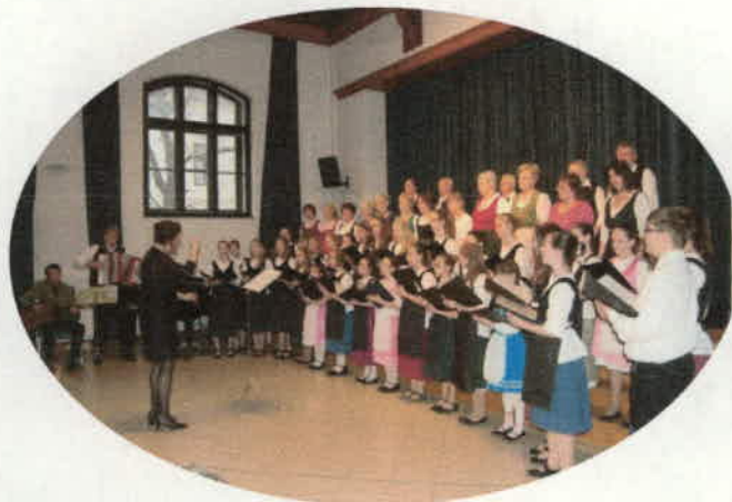
Tavaszcímű műsor a Szekszárdi Babits Mihály Általános Iskolában (3.)