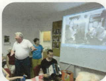
Ugyanaz a harmonika a nagypapa (vetítőképernyőn) és az unoka kezében