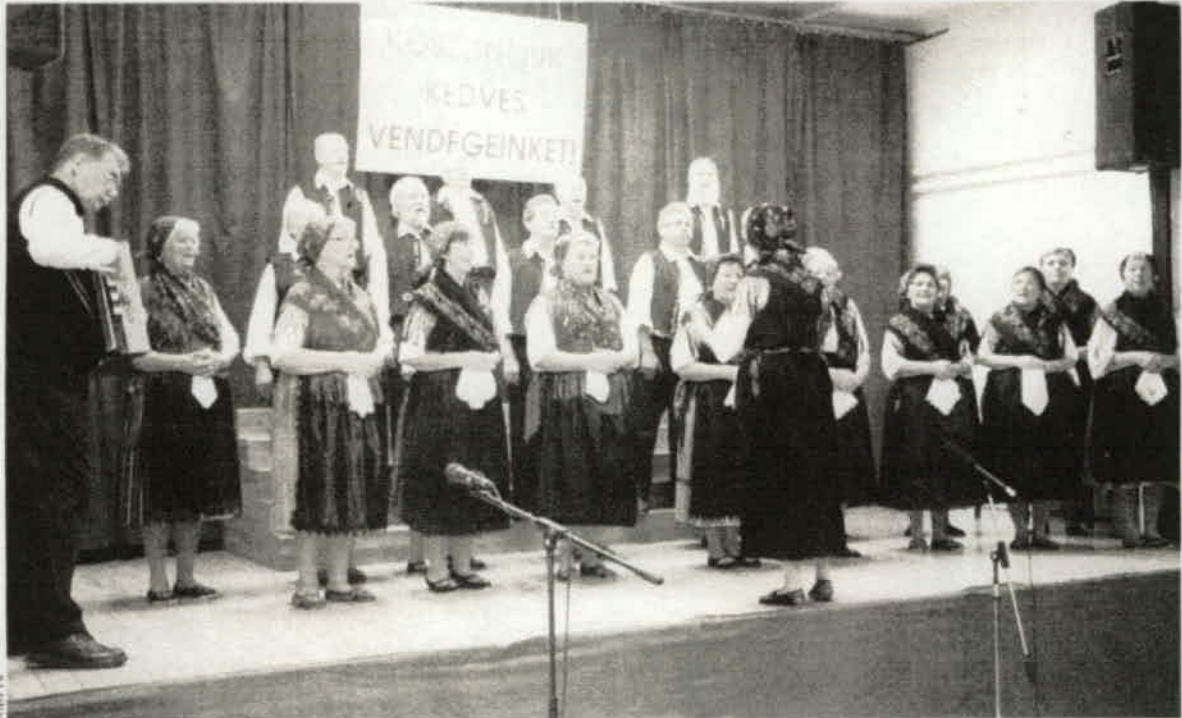
A szekszárdi Mondschein kórus népviseletét is értékelte a szakmai zsűri. A közönség a dalok végét meg sem várva tapsolt

NÉMET DALOK A legjobbak közül is kiemelkedett a Mondschein kórus