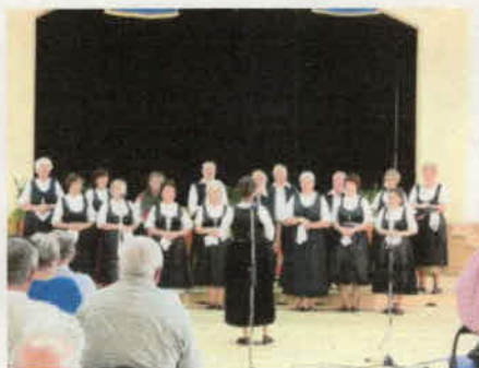
A kórystalálkozó. (10.)