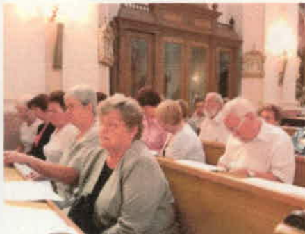
Köreműködés a német misén. (8.)