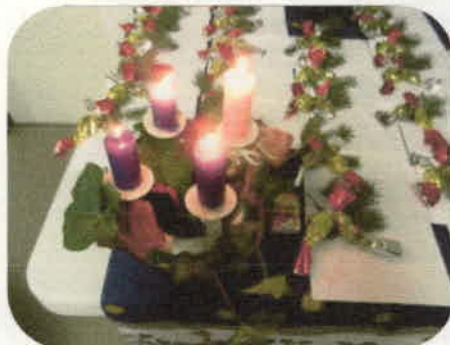
Az ünnepséget karácsonyi dalok éneklésével kezdtük.