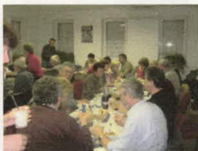
A finom vacsora.