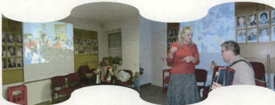
Az éneklés sem maradhatott el.