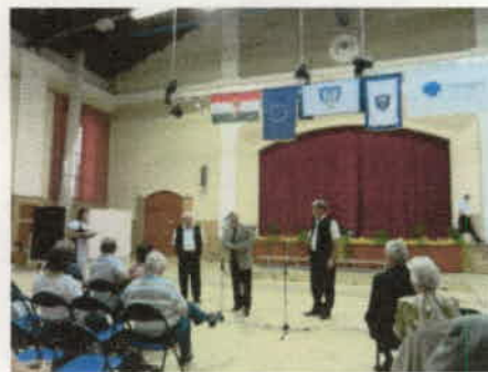
A bejelentés: harmonikásunk kitüntetését kap.