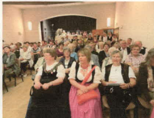
A közönség és a zsűri