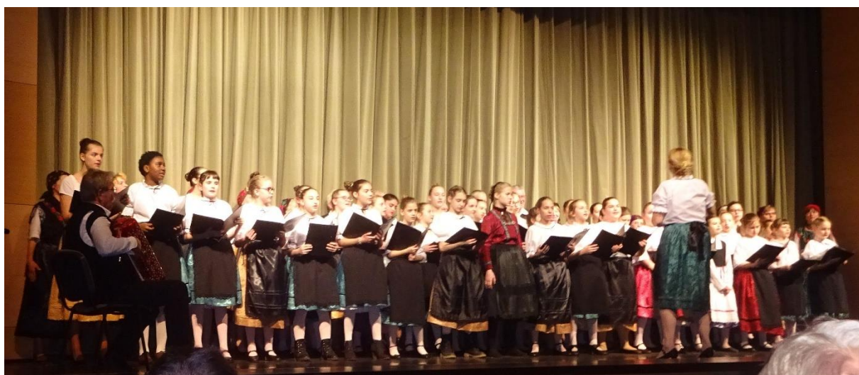
Közös szereplés a Dienes Kinderchor-ral

2020.03.07. – Tavaszi hangverseny – Tatabánya-Felsőgalla