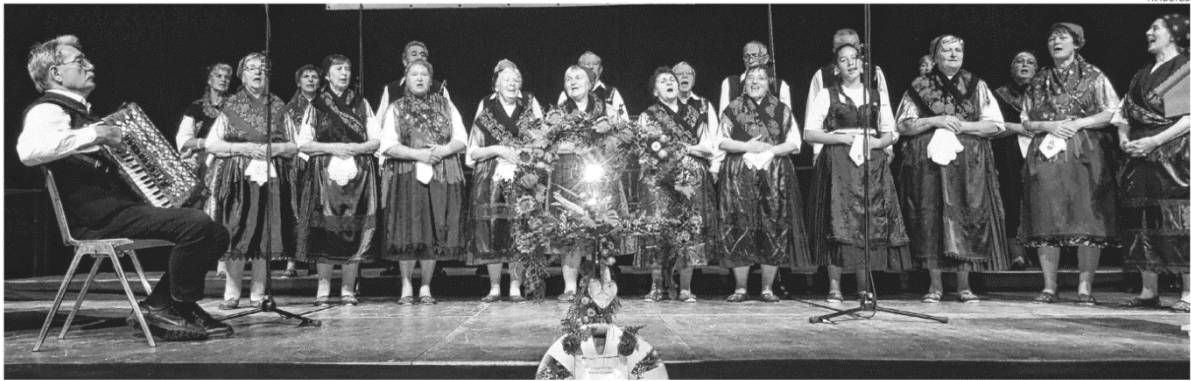
A szekszárdi kórust minden németországi fellépésén nagy örömmel hallgatta a közönség